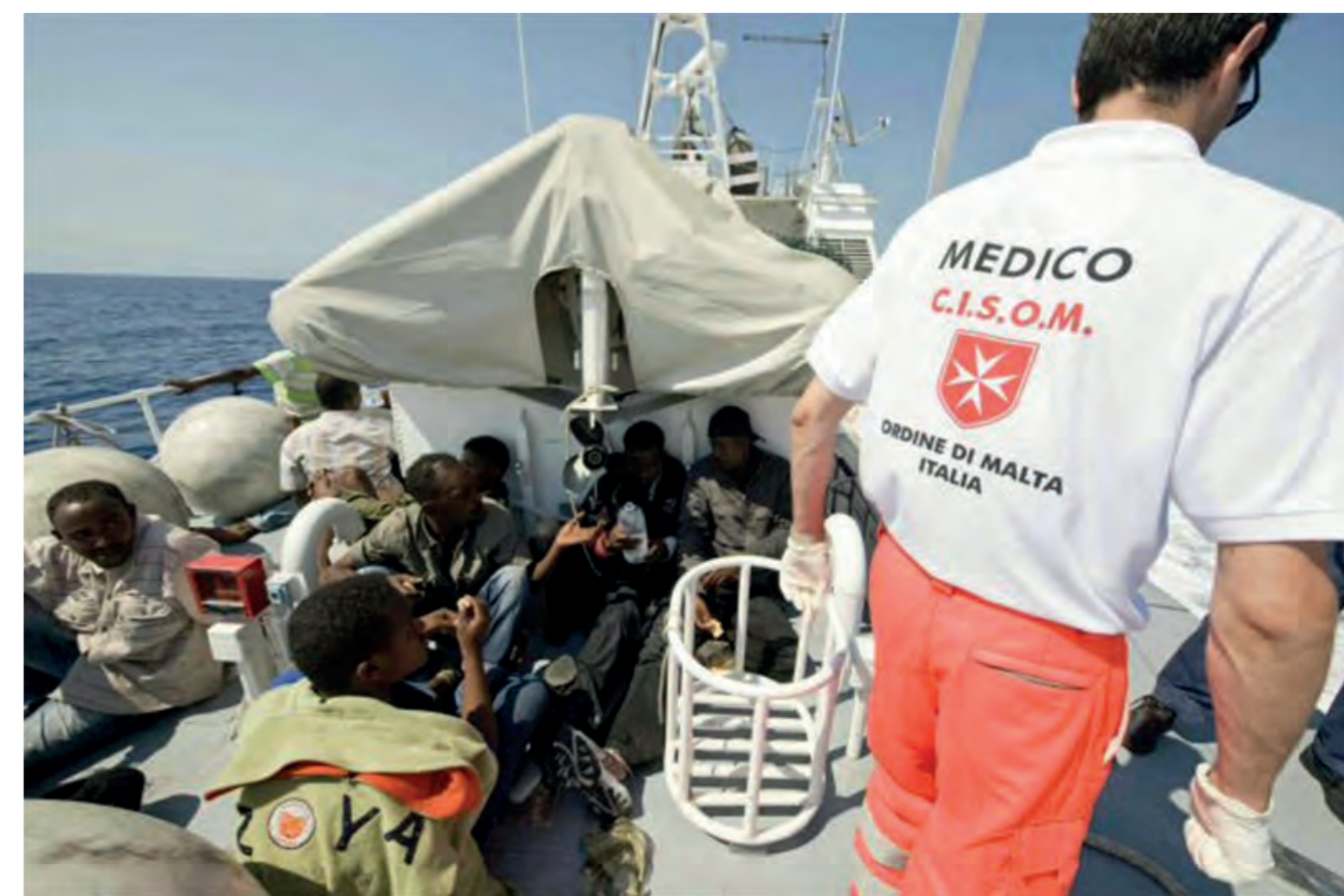
► Il C.I.S.O.M. in servizio a Lampedusa in soccorso dei migranti

L'Ordine svolge la propria azione umanitaria attraverso l'opera dei suoi 13.500 membri, 80.000 esperti volontari e 25.000 dipendenti, molti dei quali medici o paramedici. Le istituzioni dell'Ordine nel mondo – Gran Priorati, Associazioni Nazionali, organismi di soccorso e fondazioni – sono operativamente responsabili delle attività degli istituti ospedalieri, dei centri medici, degli ambulatori e dei programmi medico, sociali e umanitari.