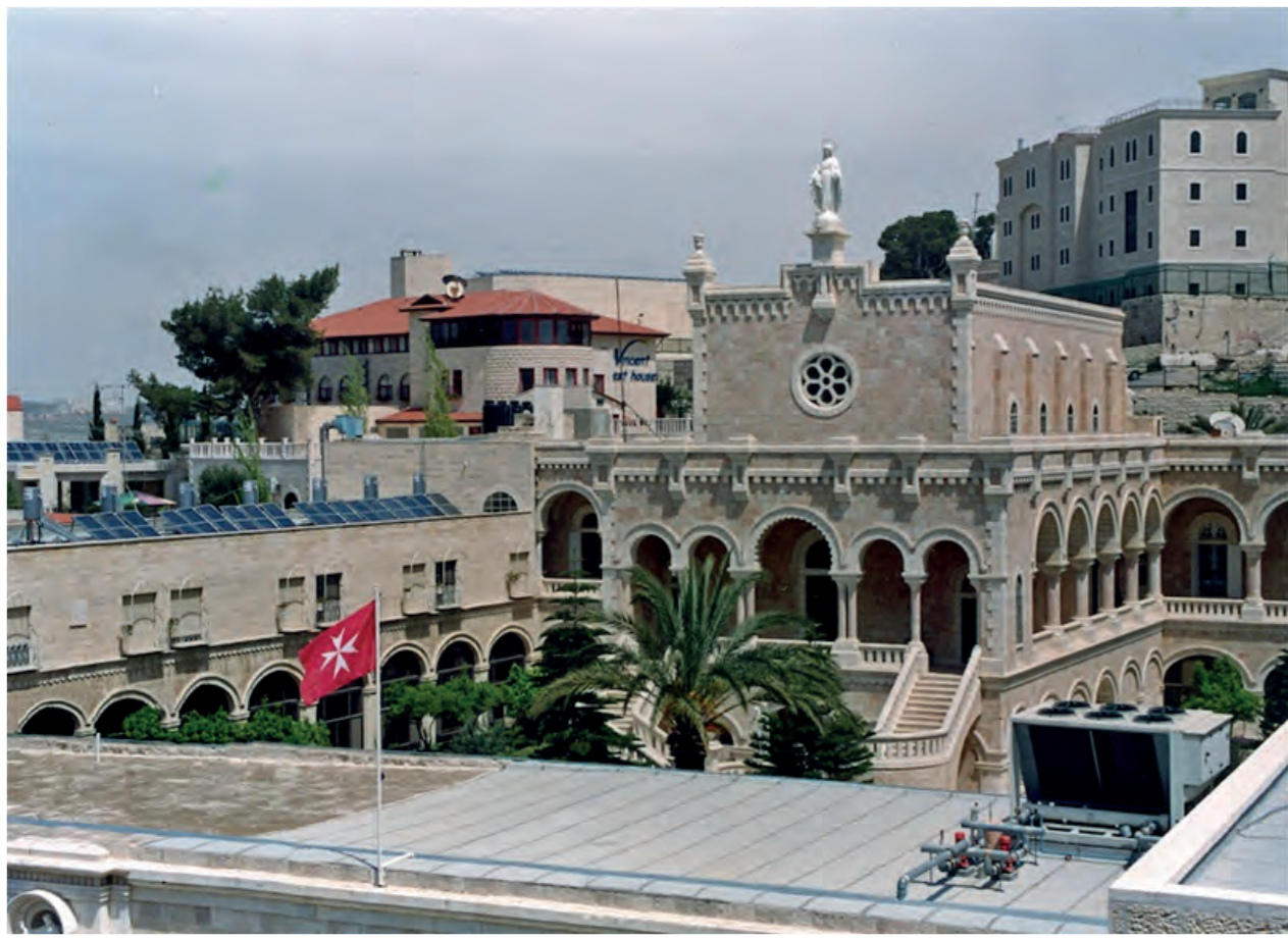
► L'Ospedale della Sacra Famiglia di Betlemme in Palestina

Molti ospedali dell'Ordine di Malta sono localizzati in Europa e più precisamente in Germania, in Francia, in Belgio, in Inghilterra e in Italia. La maggior parte sono policlinici. L'Ospedale dell'Ordine a Roma è specializzato nella neuro-riabilitazione. L'ospedale in Inghilterra e alcuni in Germania hanno unità specializzate nella terapia del dolore per i malati terminali. Strutture simili operano in Argentina, Australia, Italia, Sud Africa e Stati Uniti. L'utilizzo di terapie all'avanguardia, l'aiuto fornito da volontari appositamente formati, in un ambiente che opera secondo i principi etici cattolici è parte rilevante dell'attività sanitaria dell'Ordine. Un esempio di tale attività è l'Ospedale per la maternità di Betlemme che ha una particolare importanza: con il coordinamento dell'Associazione francese, tutto l'Ordine contribuisce alla sua operatività. Offrendo alle donne della regione l'unica possibilità di dare alla luce i propri figli in una struttura dagli standard medici di livello europeo, fornisce un servizio indispensabile alla popolazione dell'area di Betlemme. Sono più di 60.000, i bambini che vi sono nati dal 1990 ad oggi. Gli stipendi pagati ai 140 dipendenti locali, forniscono sostentamento ad oltre 2.000 persone.