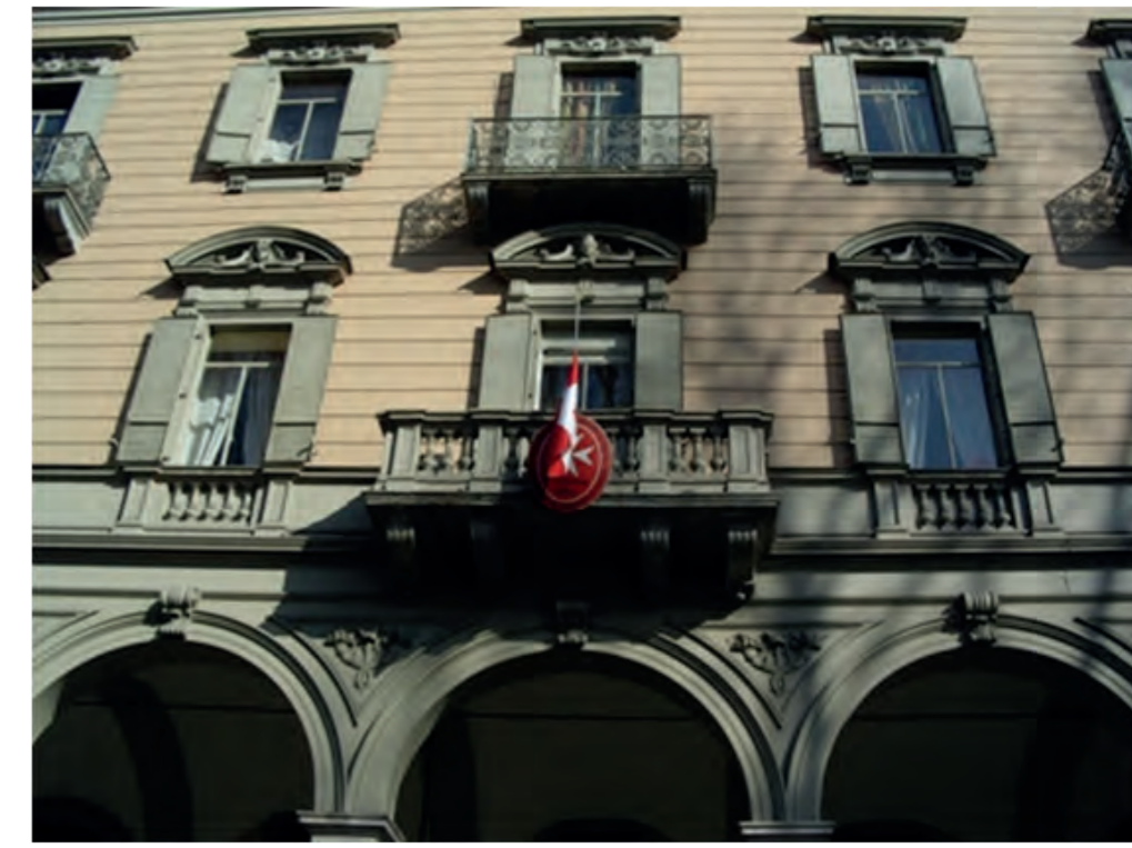
► La sede della Delegazione del Piemonte e della Valle d'Aosta in Torino

La Delegazione del Piemonte e della Valle d'Aosta , con il progetto Ambulatorio, vuole intensificare la propria presenza nel territorio, già costante grazie alla Scuola dell'Infanzia "Vittorio Emanuele II", attraverso la prestazione gratuita di servizi sanitari in ambito pediatrico, sia odontoiatrico sia oculistico.