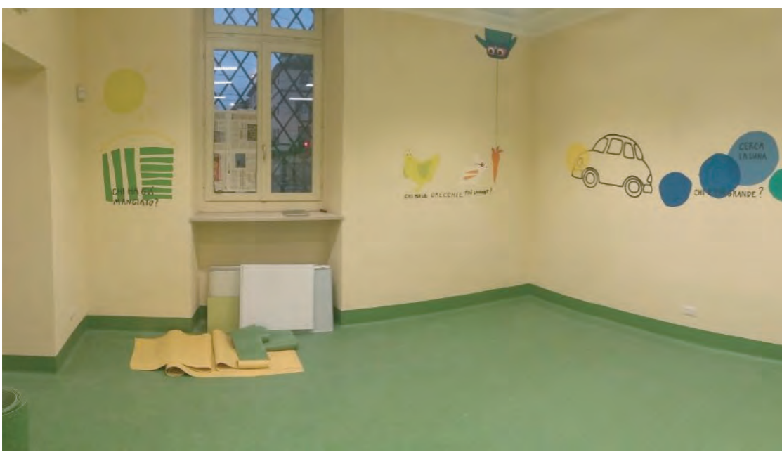
► I locali

Dopo avere effettuato, negli anni passati, i lavori più urgenti, come il rifacimento della copertura, della facciata su strada e l'adeguamento normativo e ristrutturazione del locale cucina della scuola materna, l'obiettivo in corso, conformemente allo spirito melitense, è il recupero dei locali ambulatoriali, fortemente compromessi a causa della vetustà dell'edificio e del lungo periodo di inattività.