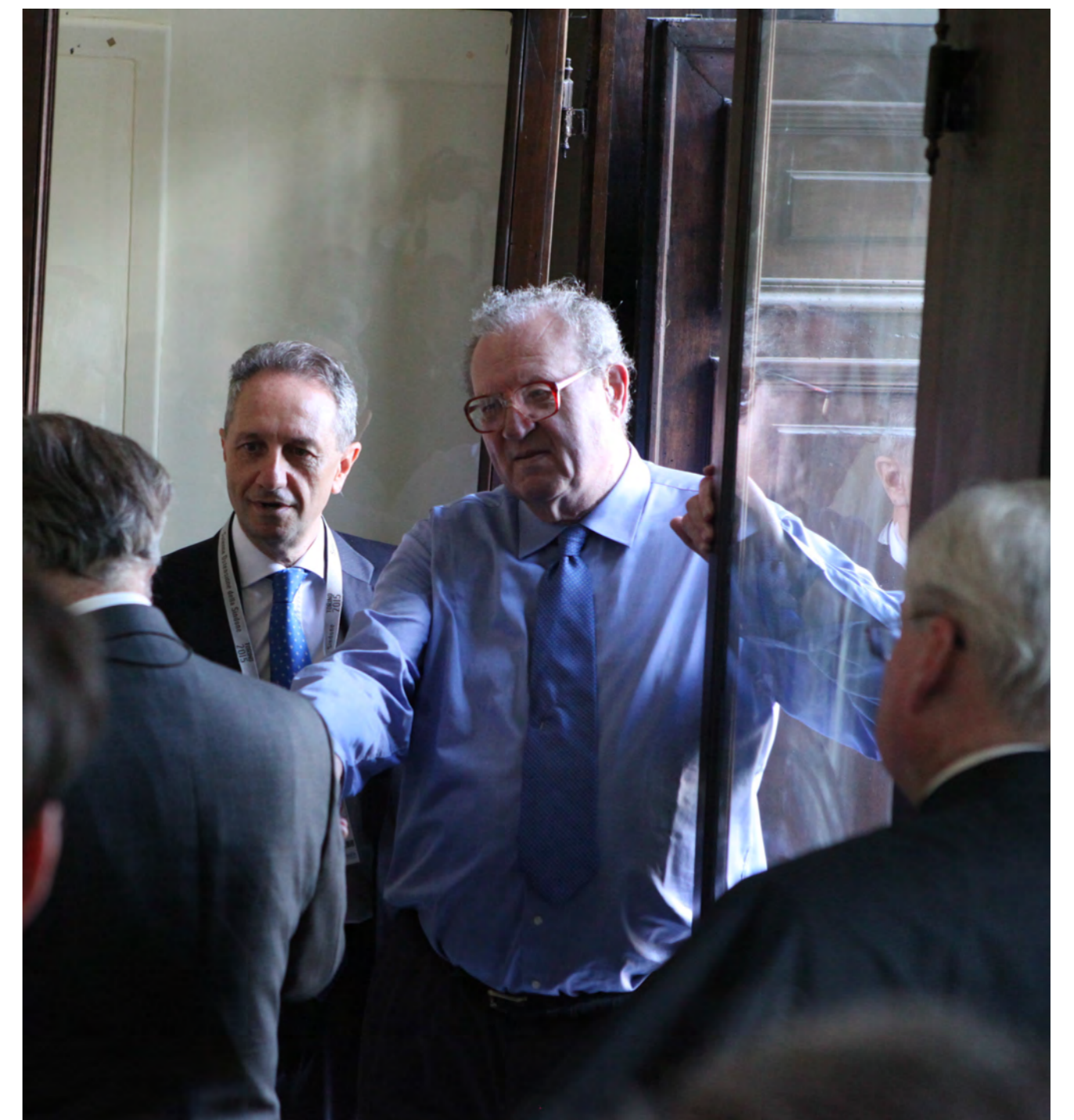
► Il Gran Maestro e le Alte Cariche dell'Ordine di Malta in visita durante i lavori