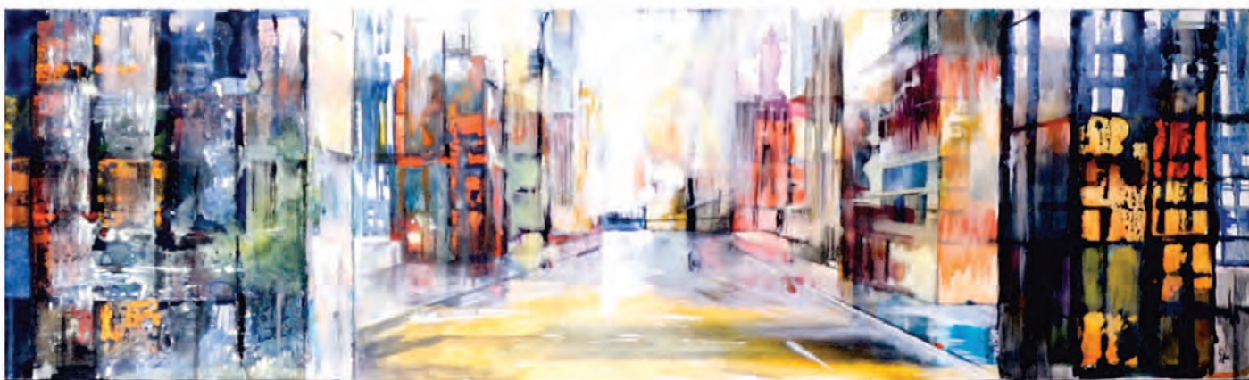
PARLO COL RAP / 2018

Mixed media. Olio, acrilici, smalti, carta su tela. 60x100 cm