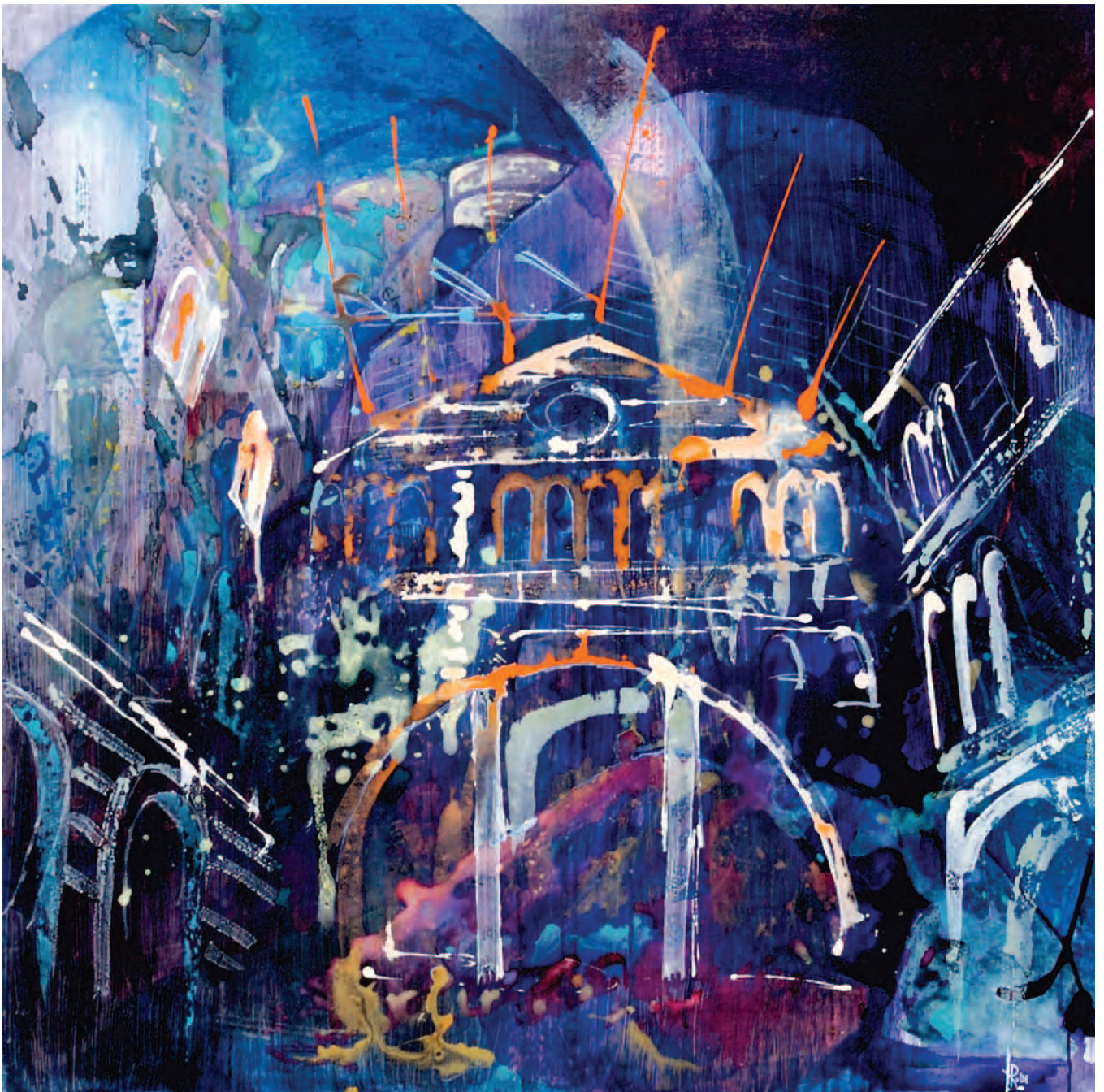
STRATI SU STRATI / 2018 Mixed media. Olio, acrilici su tela. 80x80 cm

OGR [Officine Grandi Riparazioni] - Torino