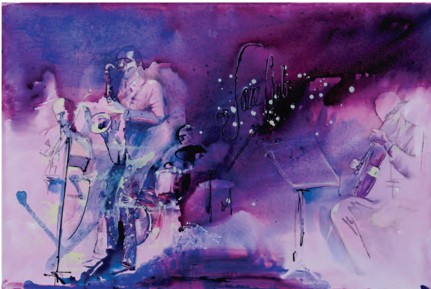
ERANO USI SUONARE / 2019

Mixed media. Olio, acrilici, smalti, carta su tela. 60x100 cm